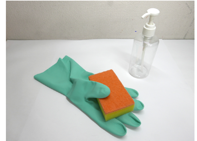
ゴム手袋と掃除道具