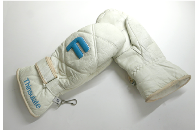
スキー用の皮手袋