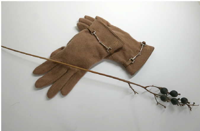
ウールの手袋と木の实