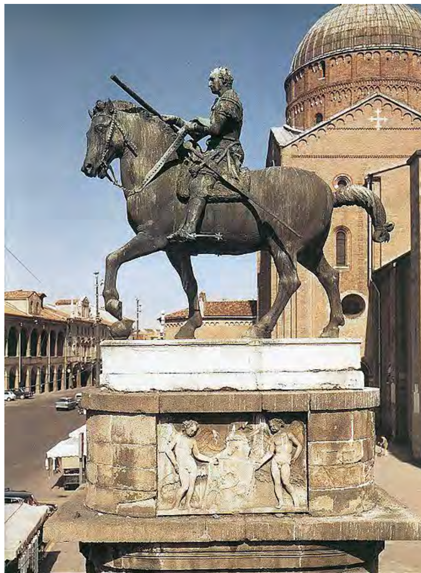
ドナテッロによる『ガッタメラータ将軍騎馬像』

作者はドナテッロ（ルネサンス初期のイタリア人芸術家・彫刻家）。 イタリア、パドヴァのイル・サント広場にある。 ガッタメラータはあだ名であり、本名はエラスモ・ダ・ナルコと言う。 あだ名のガッタメラータは「甘えん坊の猫」という意味だが、英雄の 軍人になぜそんなあだ名がついたのかは全くの不明。